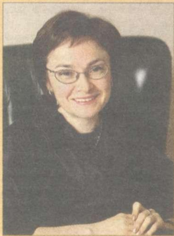
Глава Минэкономразвития Эльвира НАБИУЛЛИНА обозначила проблемы отечественной фармацевтики и медицины:

- Проблемы действительно есть, и их не решить только силами государственных структур. Ведь иногда случается так, что эти структуры оказываются лишь частично осведомленными о том, что происходит в подведомственных им областях, и не в состоянии производить качественный мониторинг ситуации. Такое положение, увы, осложняет нашу работу.