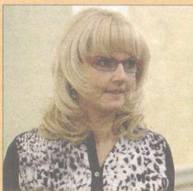
Татьяна ГОЛИКОВА, министр здравоохранения и социального развития:

- Проблемы действительно есть, и их не решить только силами государственных структур. Ведь иногда случается так, что эти структуры оказываются лишь частично осведомленными о том, что происходит в подведомственных им областях, и не в состоянии производить качественный мониторинг ситуации. Такое положение, увы, осложняет нашу работу.