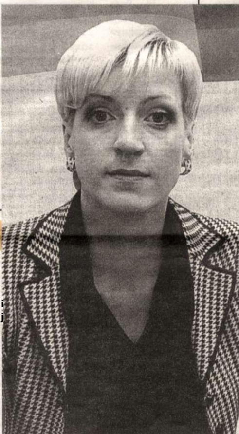
Как она может смотреть в глаза избирателям?

Не секрет, что молодые люди сейчас много времени проводят в Интернете, в социальных сетях (Одноклассники, ВКонтакте и т. д.) И на подобные события эти «сети» реагируют мгновенно, как сарафанное радио. Но даже там, где кипит и бурлит жизнь молодежи, нет ничего про эту драку. Никто не написал: «О, да, знаю, у меня там знакомый знакомого был». И не может быть, чтобы все прошли мимо зверского избияния десяти (или все-таки двенадцати? или пяти?) студентов.