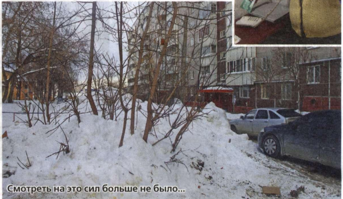
Смотреть на это сил больше не было...