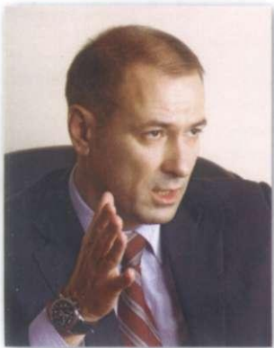
Депутат Законодательного Собрания Пермского края Константин Окунев: