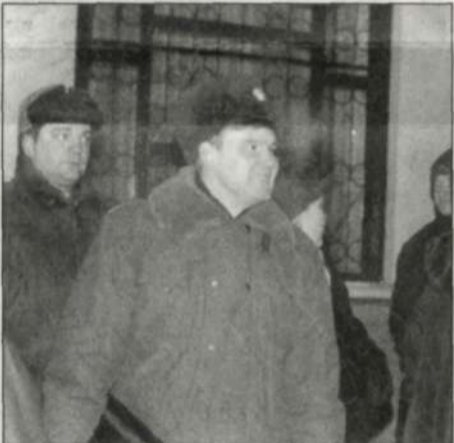
Милиция была бессильна...