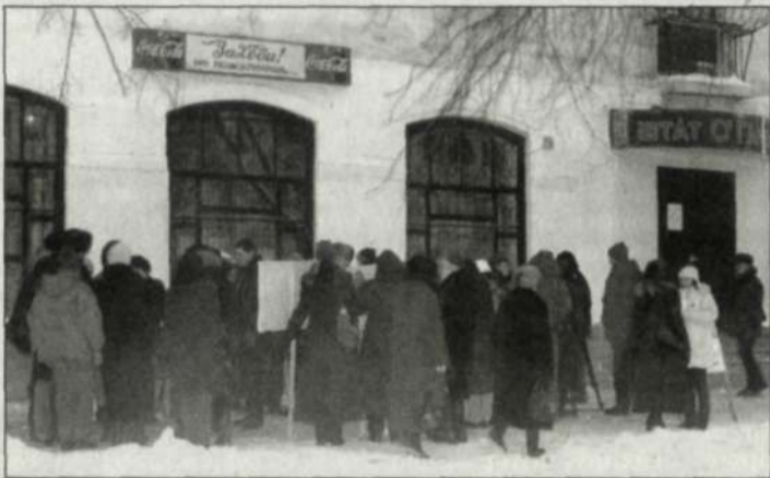
И это еще не все участники пикета...

Стриптиз в «Штате О'Гайва» больше похож на несвежую простынь в провинциальном борделе! «О'Гайва» все ближе и ближе превращается в апогей библейского разврата - Содом и Гоморру. И это