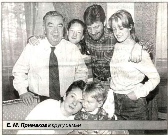
Е. М. Примаков в кругу семьи

Немало жителей Прикамья относятся с симпатией к Евгению Максимовичу. И, думается, с удовольствием бы лично сказали ему несколько теплых слов по случаю юбилея. Будьте здоровы, Евгений Максимович! Новых успехов вам на благо родного Отечества!