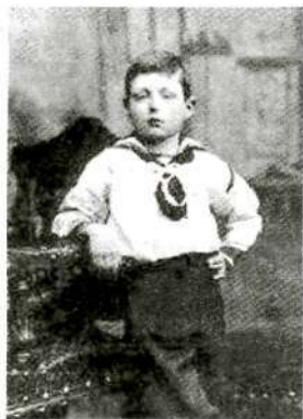
Сэр Уинстон Черчилль