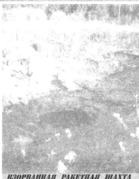
ВЗОРВАННАЯ РАКЕТНАЯ ШАХТА

Огромные средства, вложенные страной в строительство сооружений,