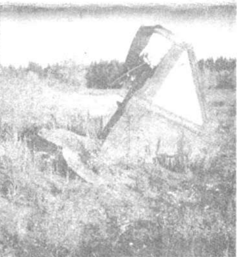
КРЫШКА РАКЕТНОЙ ШАХТЫ

Сколько сейчас по стране таких военных и не военных объектов, бро-