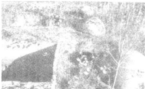
ОСТАТКИ НАВИГАЦИОННОГО ОБОРУДОВАНИЯ

Каждый такой комплекс был снабжен электроэнергией, автономными системами водоснабжения и вентиляции. Мы побывали на бывшей стартовой позиции МБР, совмещенной с командным пунктом, недалеко от