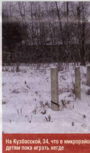
На Кузбасской, 34, что в микрорайоне Октябрьский, детям пока играть негде