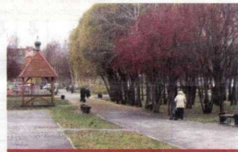
Сквер Победителей на ул. Гусарова

Не так давно у жителей Крохалева появился сквер Победителей, и сразу стал одним из любимых мест отдыха. Этот парк-дендрарий на улице Гусарова был создан в 2000 году. Начинаясь он с посадки «Аллеи Дружбы». Главная ценность - дендропарк, участие в его разработке принимали ученые-биологи ПГУ. Здесь могут не только гулять дети и отдыхать пенсионеры, но и есть место для волейбольных и баскетбольных соревнований.