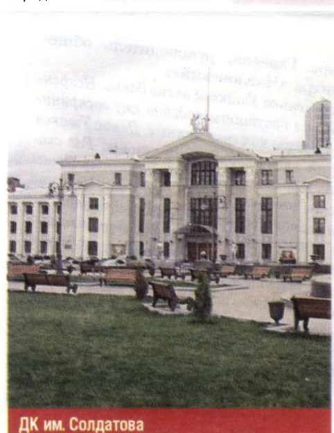
ДК им. Солдатова

Пожалуй, самое известное из них - это ДК им. Солдатова. Он не имеет аналогов в Прикамье, на Урале и даже в России. Это один из первых дворцов, построенных для работников крупнейшего предприятия, - тогда завода имени Сталина, теперь это «Пермские моторы». Его начали строить еще в 1940 году. А открыли уже после войны - 24 мая 1945 года. Так что Дворец - ровесник Победы. Сколько он повидал на своем веку! Сколько счастливых пар кружились в вальсе под его сводами, сколько коллективов выходило на его сцену - не сосчитать! И сейчас он продолжает оставаться центром притяжения не только для жителей Свердловского района, но и всего города.