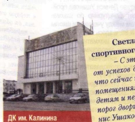
ДК им. Калинина