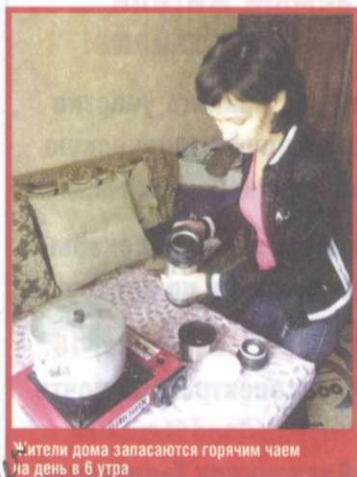
Жители дома заваривают горячим чаем на день в 6 утра