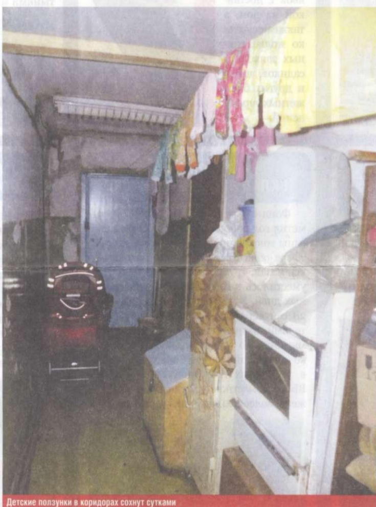
Детские ползунки в коридорах сохнут сутками

Вороно был стреляный воробей в вопросах недвижимости. Еще в конце 90-х благодаря хитроумной схеме покупки недвижимости он смог заработать свой первый стартовый