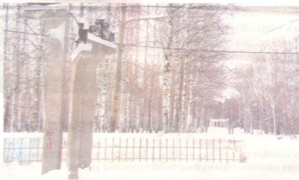
Парк имени Чехова

В целом центральный парк Орджоникидзевского района изменится до неузнаваемости. В основе про-