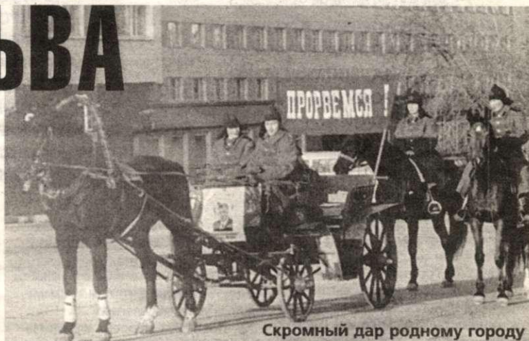
Скромный дар родному городу

Герой, готовый нам помочь в час безвременья.