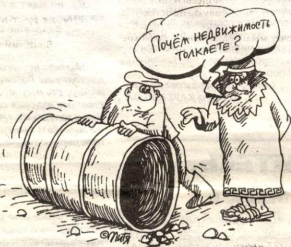
Рис. Владимира МИЛЕЙКО