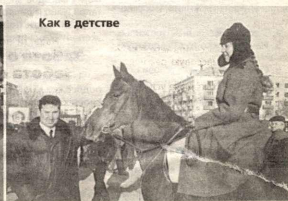
Как в детстве