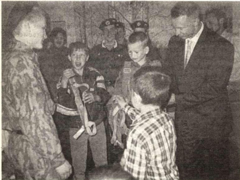
Приезд «афганцев» - для детей всегда праздник

- И второе. Больше, чем аккуратность, мы ценим честность. У нас перед входом нет половика.