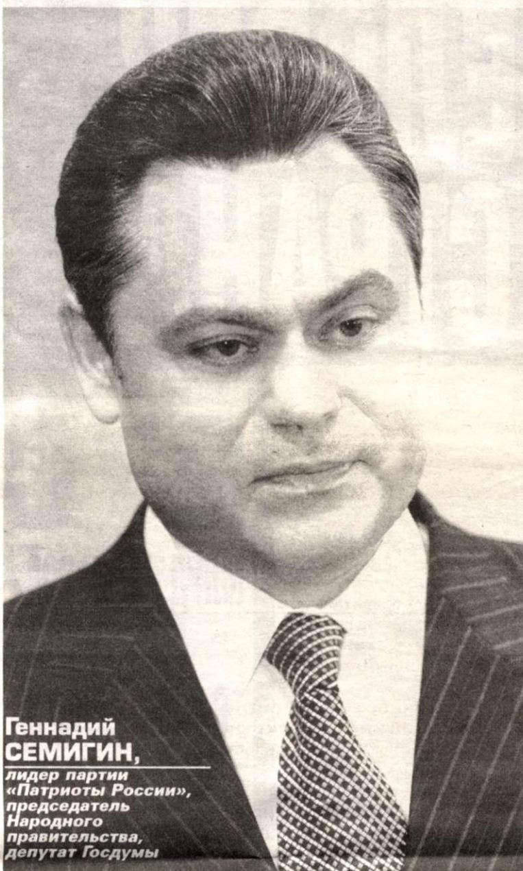
Геннадий СЕМИГИН, лидер партии «Патриоты России», председатель Народного правительства, депутат Госдумы

Участвуйте в акции «Патриоты России» и сделайте свой выбор!