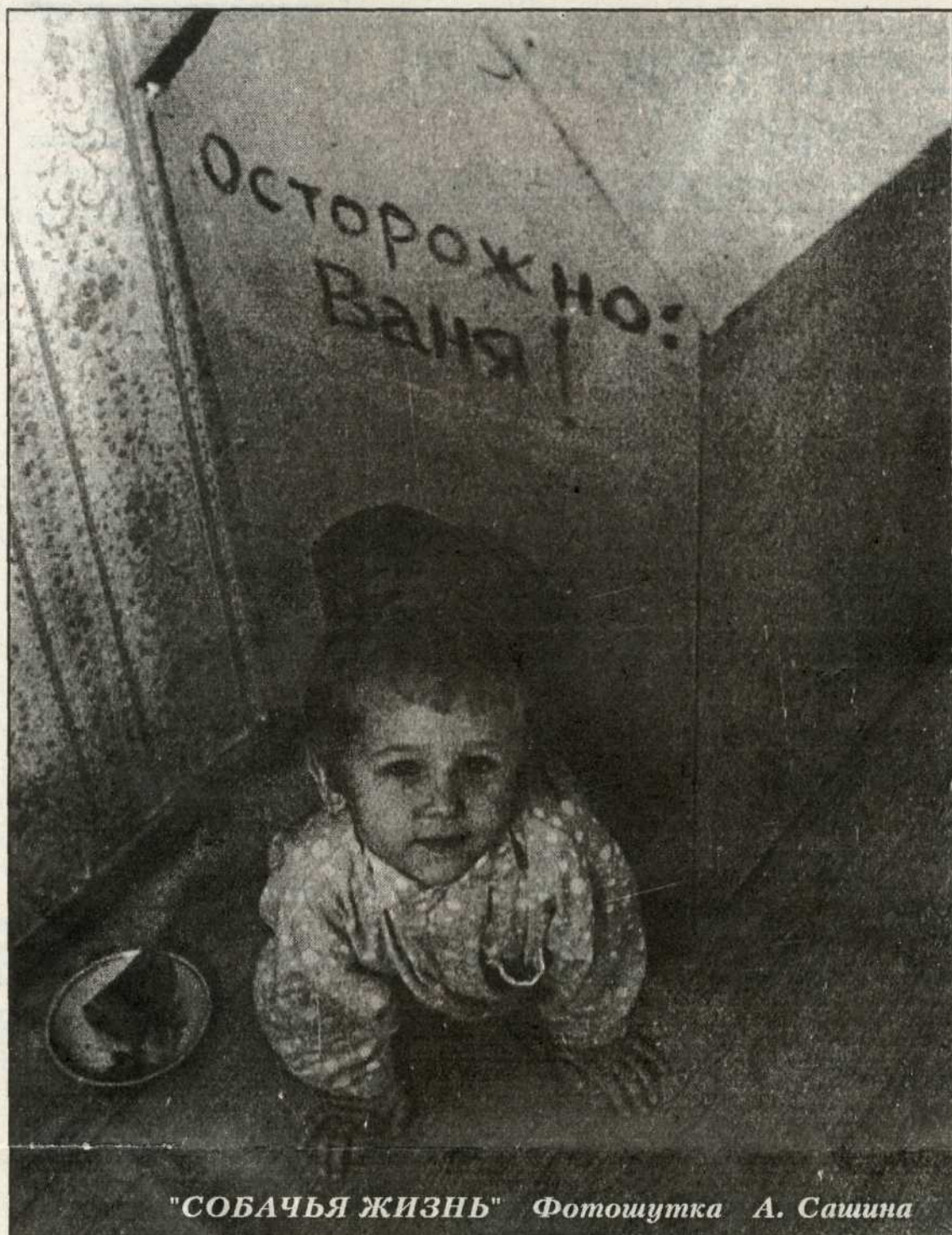
"СОБАЧЬЯ ЖИЗНЬ" Фотошутка А. Сашина

Ареной веселого спортивного праздника стал в минувшие выходные пруд в г. Добрянка. Здесь собрались сильнейшие "моржи" Западного Урала, чтобы разыграть свое открытое первенство: его участниками также стали гости из г.г. Тюмени, Каменск-Уральского (Свердловская обл.) и Одишова (Московская обл.).