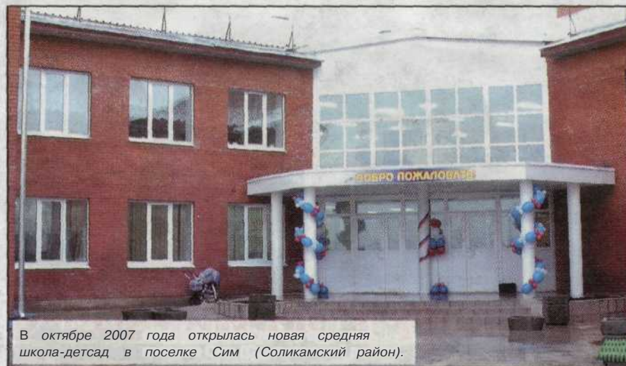
В октябре 2007 года открылась новая средняя школа-детсад в поселке Сим (Соликамский район).

С днем рождения, Пермский край! С наступлением Нового года в нашей общей славной истории. Пусть он будет светлым для каждого из нас. Потому что мы - хорошие люди.