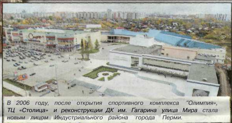
В 2006 году, после открытия спортивного комплекса «Олимпия», ТЦ «Столица» и реконструкции ДК им. Гагарина улица Мира стала новым лицом Индустриального района города Перми.