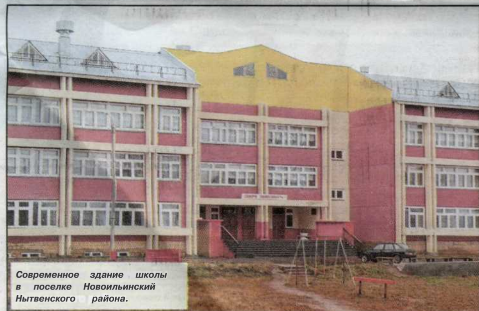
Современное здание школы в поселке Новоильинский Нытвенского района.