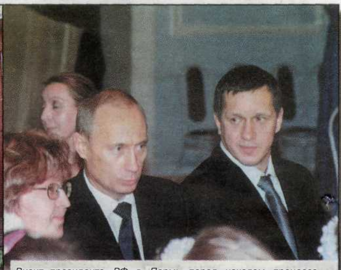
Визит президента РФ в Пермь перед началом процесса объединения Пермской области и Коми-Пермьского автономного округа. Владимир Путин посетил Дягилевскую гимназию.