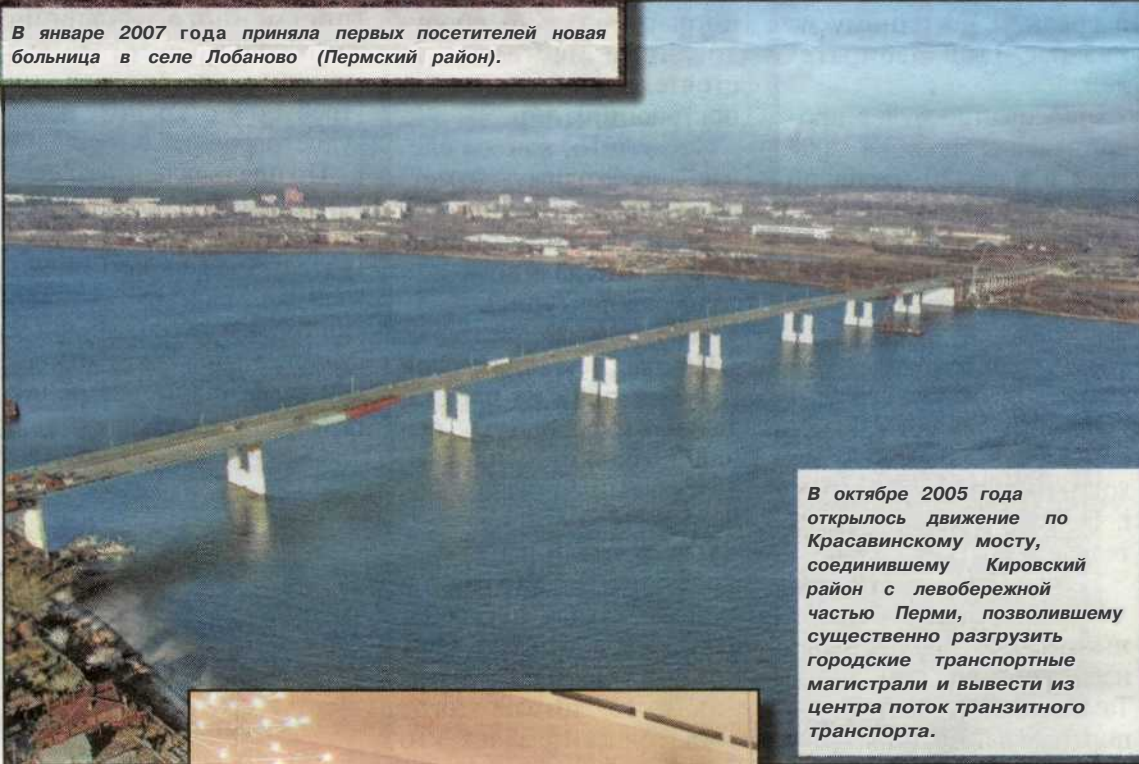
В октябре 2005 года открылось движение по Красавинскому мосту, соединившему Кировский район с левобережной частью Перми, позволившему существенно разгрузить городские транспортные магистрали и вывести из центра поток транзитного транспорта.