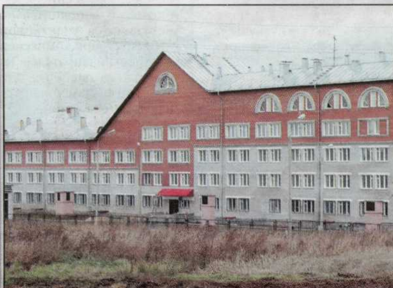
В январе 2007 года приняла первых посетителей новая больница в селе Лобаново (Пермский район).