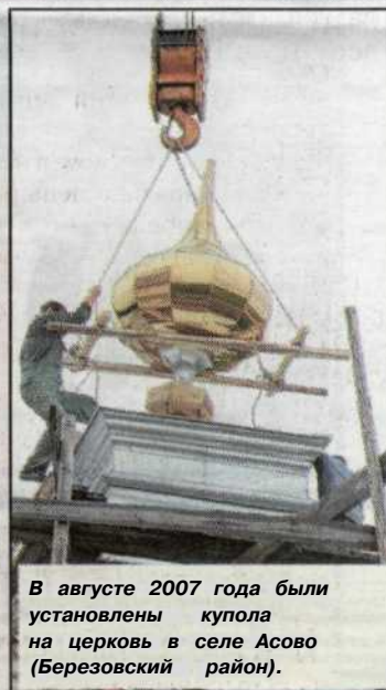
В августе 2007 года были установлены купола на церковь в селе Асово (Березовский район).