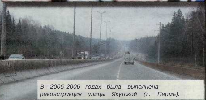
В 2005-2006 годах была выполнена реконструкция улицы Якутской (г. Пермь).