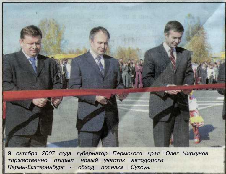
9 октября 2007 года губернатор Пермского края Олег Чиркунов торжественно открыл новый участок автодороги Пермь-Екатеринбург - обход поселка Суксун.