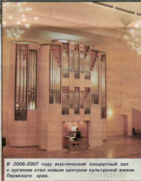
В 2006-2007 году акустический концертный зал с органом стал новым центром культурной жизни Пермского края.