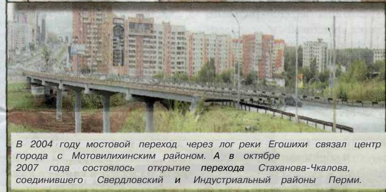
В 2004 году мостовой переход через лог реки Егошихи связал центр города с Мотовилихинским районом. А в октябре 2007 года состоялось открытие перехода Стаханова-Чкалова, соединившего Свердловский и Индустриальный районы Перми.