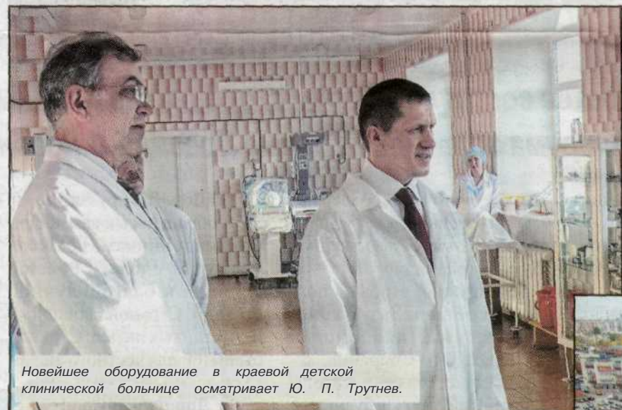
Новейшее оборудование в краевой детской клинической больнице осматривает Ю. П. Трутнев.