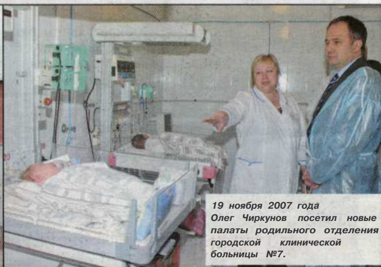
19 ноября 2007 года Олег Чиркунов посетил новые палаты родильного отделения городской клинической больницы №7.