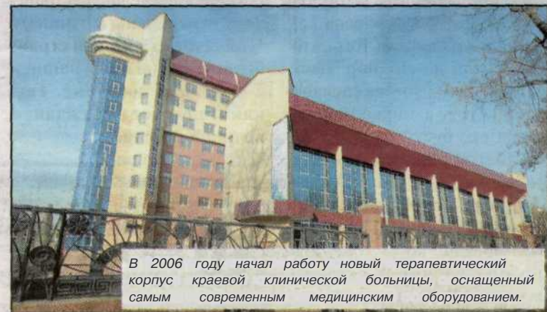
В 2006 году начал работу новый терапевтический корпус краевой клинической больницы, оснащенный самым современным медицинским оборудованием.