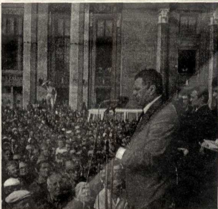
В. В. ЖИРИНОВСКИЙ на митинге у Дворца им. Свердлова (г. Пермь)