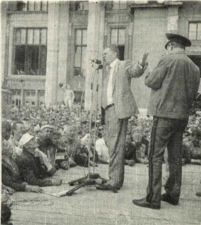
На снимке: митинг у ДКиТ им. Свердлова.

Роль личности и какие-то события потом оцениваются более положительно или, наоборот, более отрицательно. Все хлопали Сталину, пока он был жив. А сейчас многих выворачивает от того, что они