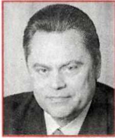
Геннадий СЕМИГИН, лидер партии «Патриоты России», председатель Народного правительства: