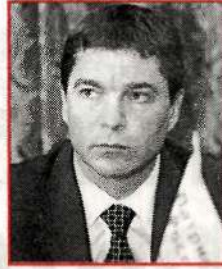
Сергей МАХОВИКОВ, актер, народный министр культуры:

– Помните о родителях. Они о вас думают и ждут.