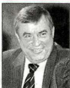
Геннадий СЕЛЕЗНЕВ: Голосуйте за себя, поддерживайте патриотов