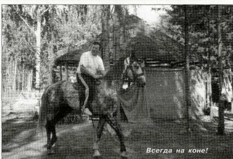
Всегда на коне!

- Ох, простите, - сказал он, просмеявшись. - У нас в округе избиратель-то знаете, с какой подковыркой?.. Такие вопросы порой задают, что не сразу и с мыслями соберешься. И кто-нибудь из женщин, точь-в-точь как вы, обязательно спросит, отчего это я не охотник круто выпить.