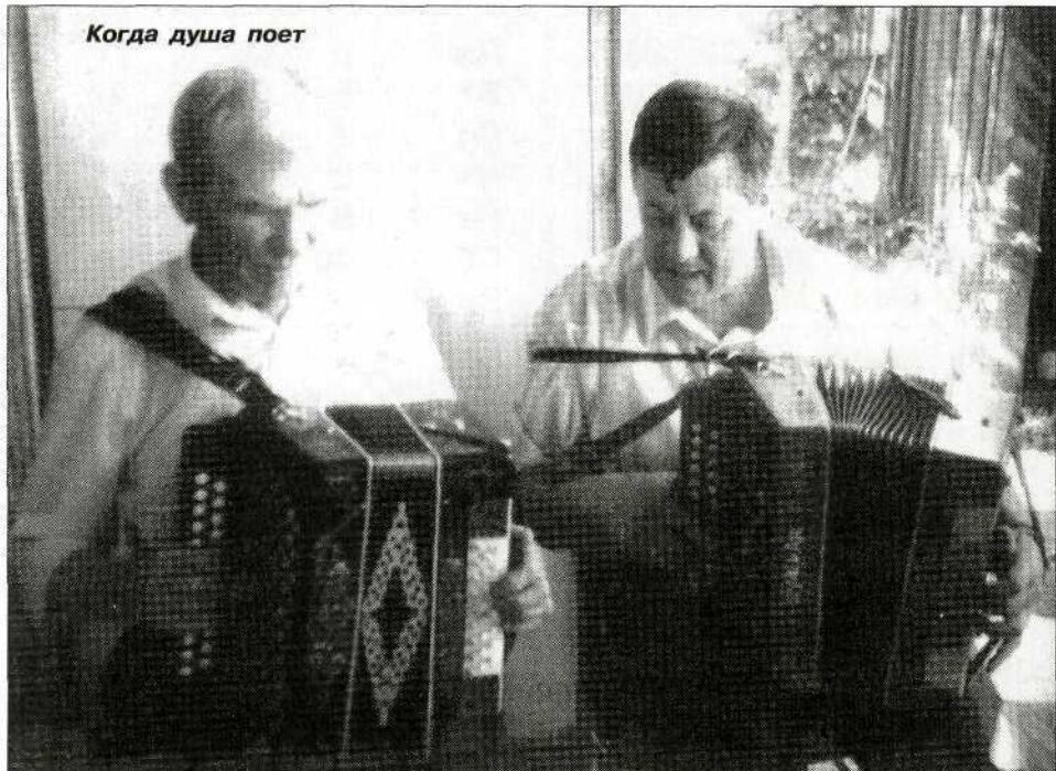
Когда душа поет

- Еще как, особенно - собирать. А уха из только что пойманной рыбы? С дымком, а? С лавровым листочком, перчиком и картошкой? А по полям верхом промчаться? У костра песни попеть, в баню сходить... И какой их отель мне на ночь сеновал предоставит?