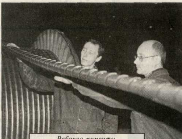
Рабочие моменты конкурса

Производство бронекабелей не первый раз выступает в роли первопроходца. Не только по части изготовления новых кабелей. Это — то для коллектива корпуса N3/5 стало делом привычным. Ну, поменялась номенклатура, нужен сегодня нефтяникам теплоустойчивый кабель марки КППП, с новыми видами изоляции, требования к качеству стали еще более жесткими, объемы выросли... Работа есть работа. И с ней у нашего самого основного из основных заводских цехов все в порядке.