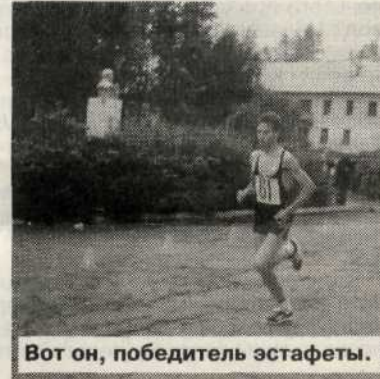
Вот он, победитель эстафеты.