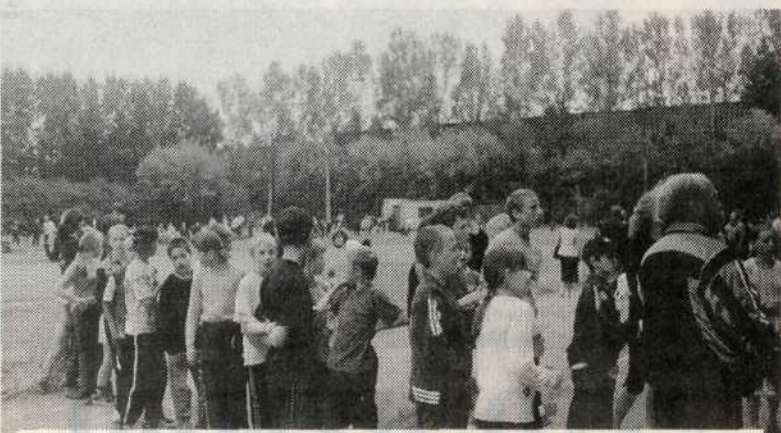
Желающих поиграть в дартс было немало.