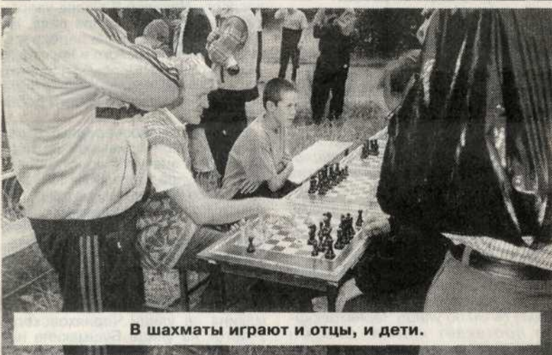
В шахматы играют и отцы, и дети.