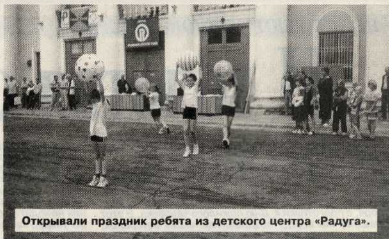
Открывали праздник ребята из детского центра «Радуга».