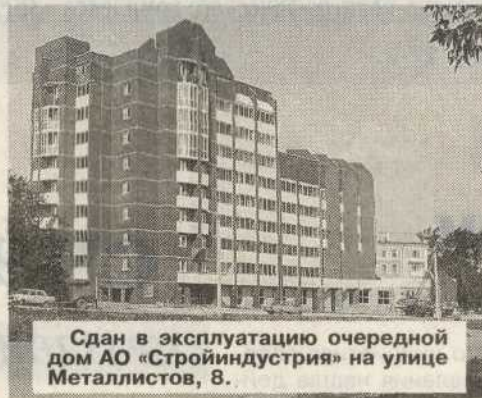
Сдан в эксплуатацию очередной дом АО «Стройиндустрия» на улице Металлистов, 8.

Само по себе введение ипотеки без увеличения объемов строительства приведет лишь к очередному взлету цен на жилье. А нарастить объемы можно будет лишь в том случае, если руководство города, как я уже сказал, отменит многочисленные поборы с